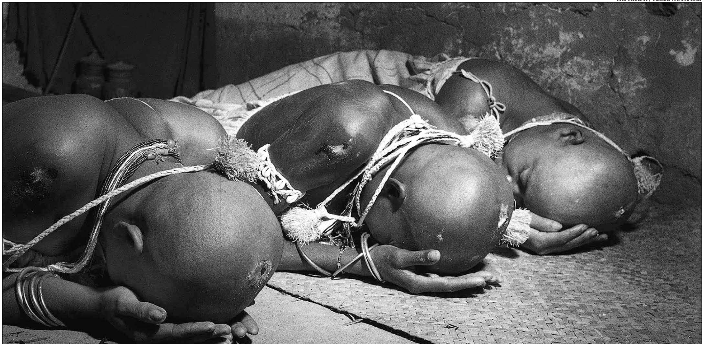
As fotos publicadas em O Cruzeiro em 1951 mostram filhas de santo de mãe Riso, ialorixá baiana, durante os ritos iniciáticos do candomblé, também conhecidos como feitura de santo

ENTREVISTA Fernando de Tacca, antropólogo