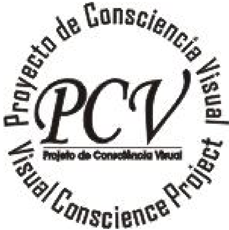
Imagem positiva e negativa