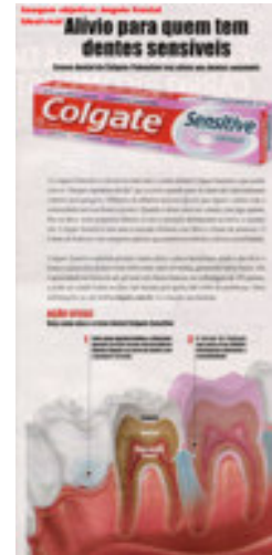
Figura 6. Imagem Objetiva - Frontal