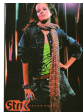
Figura 9. Poder do PR

As imagens subjetivas ainda produzem significações expressivas no que diz respeito às relações de poder que se estabelecem entre PR e PI. Assim, que é possível dizer resumidamente, que quando o PR está representado olhando para cima, é o PI quem se encontra em posição de poder; quando o PR olha no olho do PI, existe certa igualdade de poder entre eles; e ainda, quando o PR olha para baixo, acaba por colocar o PI em situação de inferioridade. Essas três relações de poder que se estabelecem entre PR e PI podem ser observadas nas Figuras 7, 8 e 9, respectivamente. Já as imagens objetivas, que dão ao leitor a impressão de que ele possui diferentes pontos de vista, são constituídas de duas maneiras básicas: uma estrutura de topo-base (Figura 10) e outra frontal (Figura 6). A primeira delas tem a intenção de induzir o leitor-consumidor a uma impressão de conhecimento e poder máximo sobre determinada imagem, é como se ele possuísse uma "visão de Deus", de acordo com Kress e van Leeuwen (1996). Esse tipo de imagem é pouco utilizada na publicidade, assim para exemplificar foi utilizada uma ilustração de uma reportagem do Jornal Zero Hora de dezembro de 2005, que teve como objetivo demonstrar ao leitor todo o complexo que será construído para abrigar os vendedores ambulantes da cidade de Porto Alegre. Ao passo que a segunda sugere envolvimento máximo e ação, é como se o anunciante dissesse ao leitor-consumidor: "Isto funciona