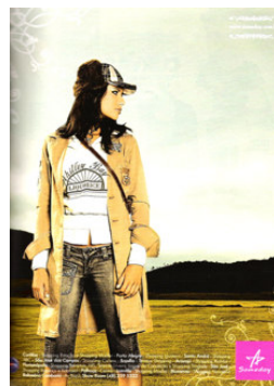
Figura 2 - Oferta

O segundo aspecto, destacado na gramática do design visual por Kress e van Leeuwen (1996), está relacionado à distância social que se estabelece entre PR e PI (respectivamente, personagem humano ou personificado e leitor-consumidor do anúncio) (Figuras 1, 3 e 4). O que determina a distância social entre PR e PI é o tipo de corte utilizado na fotografia. Dessa forma, se o plano for aberto ou geral, exibindo o corpo inteiro do PR, pode-se dizer que a distância que se estabelece entre os participantes é máxima, conferindo um caráter de impessoalidade, ou seja, os participantes não se conhecem, como se pode observar na Figura 3. A mulher que está representada no anúncio não mantém e não busca manter contato com o leitor, sendo que ela parece estar distante e, além disso, não olha para o leitor, enquadrando-se também no aspecto que foi analisado acima como oferta. O leitor, neste caso, assume a postura de um mero observador, um voyeur que flagra uma cena não-convencional: uma mulher que serve um copo de Martini para alguém que se encontra dentro do armário.