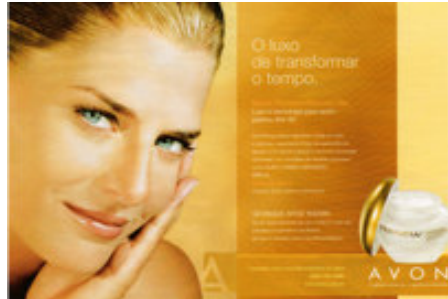
Figura 4. Close

O terceiro aspecto destacado na gramática do design visual de Kress e van Leeuwen (1996) está relacionado à atitude, que pode ser de subjetividade (Figuras 5, 7, 8 e 9) quando o leitor se submete a um único ponto de vista – o do produtor da imagem; ou de objetividade em relação à imagem (Figuras 6 e 10), quando o produtor faz com que o leitor tenha a sensação de poder observar a imagem por diversos pontos de vista. As imagens subjetivas são caracterizadas pelo uso de fotografias ou desenhos de seres humanos ou seres personificados (Figura 5), enquanto que as objetivas são imagens técnicas e científicas, como diagramas, mapas e esquemas, que codificam uma atitude objetiva (Figura 6).