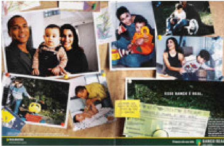
Figura 5. Subjetividade