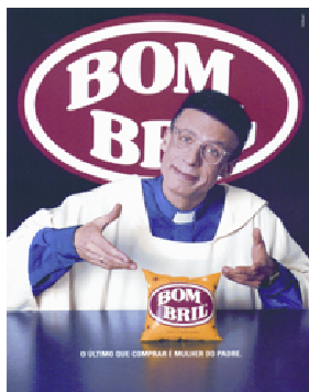
Figura 1 – Pedido/Interpelação

de um personagem que olha nos olhos do leitor, é denominado pedido ou interpelação. É como se o personagem exigisse ou esperasse algo ou alguma ação do espectador daquele anúncio (Figura 1). No anúncio de Bom Bril, o Garoto Bom Bril, que aparece como Padre Marcelo Rossi, parece implorar com benevolência para que o consumidor compre Bom Bril, além disso, o texto verbal fortalece o pedido em tom de ameaça: "o último que comprar é mulher do padre". O segundo caso, quando esse vetor parte do olho do PR mas não acaba nos olhos do PI, é denominado oferta. Nesse caso, o intuito da representação não seria de aproximação, mas, ao contrário, de colocar-se em uma posição que não é a mesma em que o leitor se encontra. Nesse caso, a sedução está em fazer com que o consumidor deseje estar na posição daquele PR, como acontece na Figura 2. No anúncio da grife Someday, o que se pretende, possivelmente, não é uma identificação entre PR e PI, mas sim, um distanciamento proposital, no sentido de que uma aproximação entre eles só aconteceria com a compra e o conseqüente uso das roupas anunciadas.