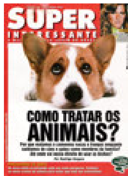
Figura 7. Poder do PI leitor