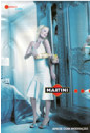
Figura 3. Plano aberto

caso, pode-se tomar como exemplo o anúncio da Figura 4. Em se tratando de produtos de beleza, pode-se identificar como prática comum entre as mulheres aconselhar e ouvir conselhos de suas amigas sobre os produtos que deve usar. Assim, para representar uma distância social mínima entre PR e PI, utiliza-se o close, neste caso, o rosto da PR em detalhe. Esse corte é utilizado também, e obviamente, em anúncios de produtos de beleza para que sejam evidenciados os possíveis efeitos que se pode obter com o uso de determinado produto.