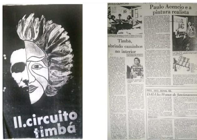
Figura 2: Clipping sobre II Circuito Timbá

O II Circuito Timbá (Figura 2) foi realizado em 1986 durante todo o ano. O patrocínio foi por conta do Estado e da União, deslocando-se equipes de visitação pelas cidades por onde o circuito iria passar. Como equipe coordenadora, cinco pessoas compuseram a comissão. Não obtiveram-se informações sobre as identidades de tais pessoas, pois o Relatório de Atividades não contava com nenhuma (TIMBÁ, 2021)