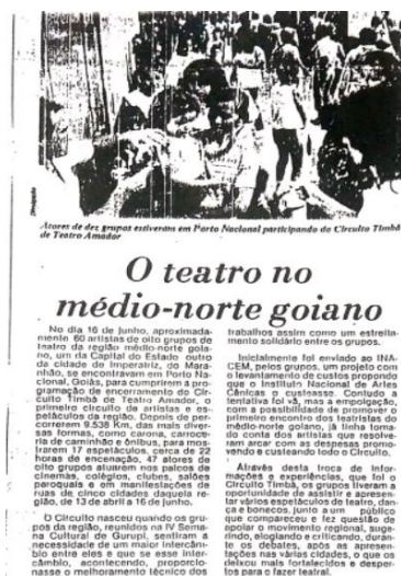
Figura 4: Matéria sobre projeto Timbá em 1987