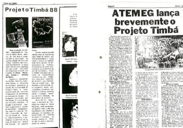
Figura 5: Jornais sobre o Projeto Timbá em 1988