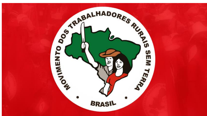
Bandeira do Movimento dos Trabalhadores Rurais Sem Terra

Como dito, desde a fundação do movimento, a arte tem seu lugar inegável dentro do MST, a começar pela construção de suas simbologias. Tomando como exemplo a bandeira 9 que hoje representa a luta camponesa brasileira sem terra, símbolo de identidade do movimento, foi elaborada coletivamente durante o 4º encontro nacional em 1987. Como disponível no site oficial do MST 10 , a bandeira dispõe o vermelho como cor predominante, representando o sangue e a disposição para a luta, o branco expressa a paz almejada no alcance da justiça social, o preto traz o luto e também homenageia os companheiros que não mais estão presentes nessa vida, o mapa corresponde a nacionalidade do MST e a necessidade da reforma agrária em todo o país, o verde transmite a esperança da vitória em todo território, a trabalhadora e trabalhador demonstra a composição dos membros do movimento e o facão (ultrapassando o mapa do Brasil) manifesta a internacionalização da luta, além de ser a ferramenta de trabalho e resistência dos camponeses sem terra.