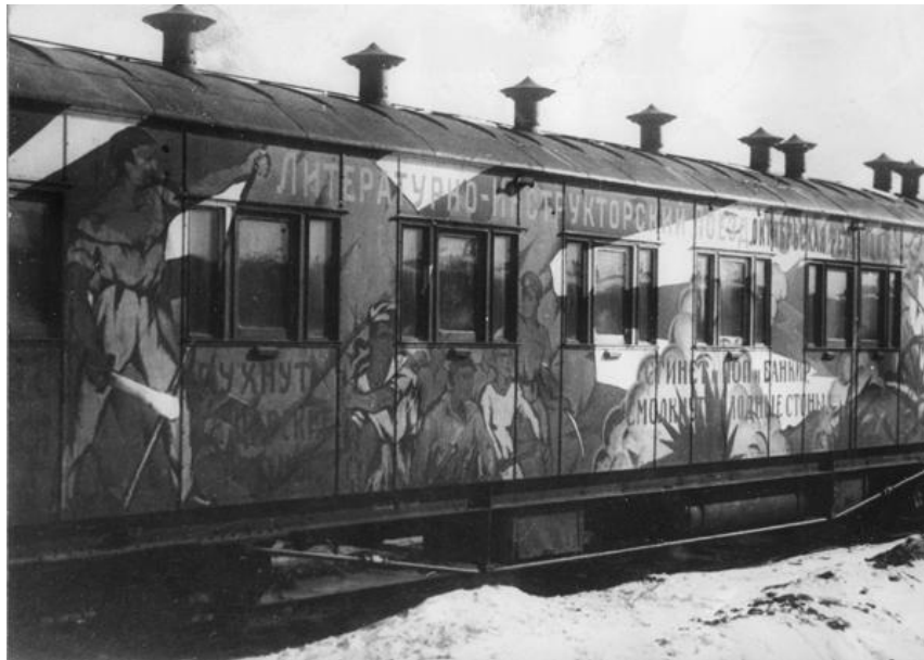
Agit-train Revolução de Outubro / Vertov-Coleção, Museu do Cinema austríaco

jornais distribuídos ao povo, uma câmara escura para a produção de fotografias, toca-discos e projetores para exposição de filmes referentes aos interesses da luta proletária, sendo alguns filmes produzidos expressamente para a mostra nessas salas de projeção.