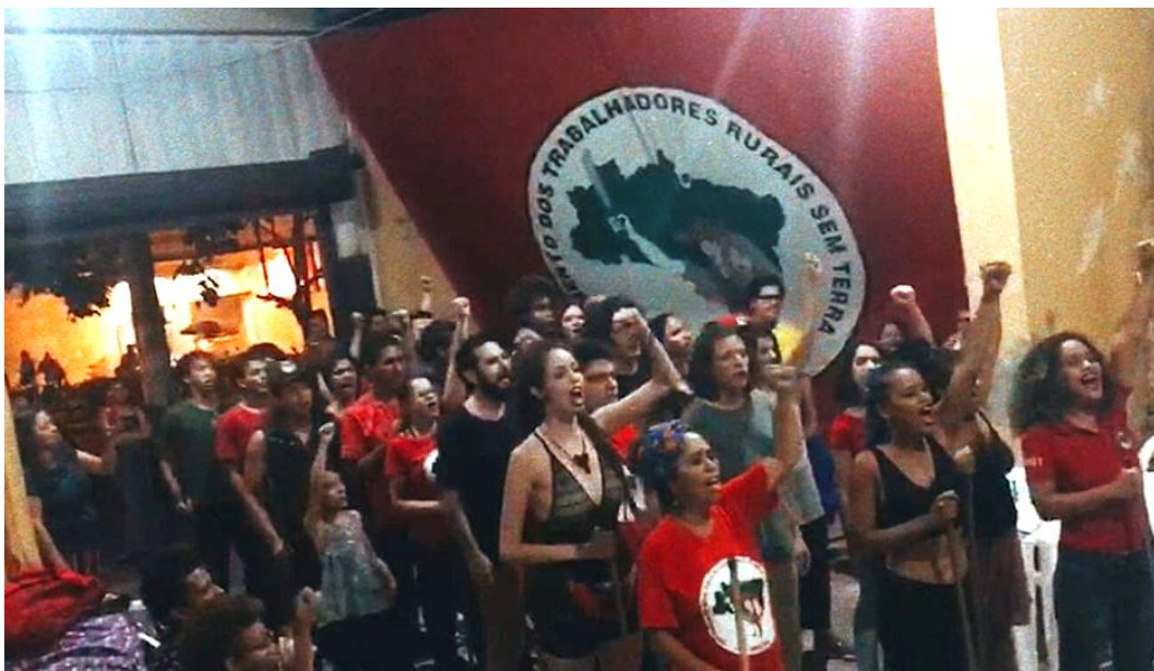
Apresentação para o festejo de conclusão da II Escola de Artes João das Neves (2019) Armazém do Campo (Belo Horizonte)

Enquanto o coro continuava com as vocalizações melódicas que compunham a música, eram entoadas (com as mãos esquerdas dos militantes levantadas) algumas repetidas vezes as seguintes palavras de ordem “MST: por terra, arte e pão!”, “Pátria livre, venceremos!” e “Mulheres em luta semeando resistência!” sem que houvesse a interrupção dos sons melódicos, instituindo um revezamento mútuo entre o grupo. Concluindo as repetições, o coro desligava-se e cada militante colocava-se próximo a alguém do público, ainda contando com os passos dançantes e a sonorização vocal. Enfim os sons melódicos diminuíram o volume, até cessar.