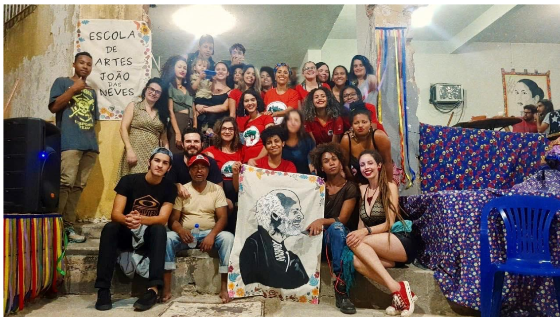
Corpo discente no encerramento da II Escola de Artes João das Neves.

Diante do exposto, estranho seria desunir o teatro de agitação e propaganda do Movimento dos Trabalhadores Rurais Sem Terra, uma vez que ambos mantêm profundos e longos objetivos e fundamentos em comum e quando congregados caminham, inegavelmente, ao enriquecimento da luta na instância política, organizativa, cultural, pedagógica, metodológica e formativa.