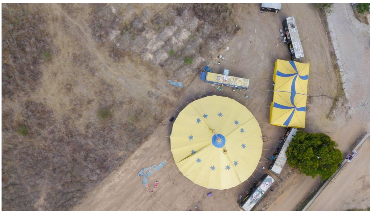
(Circo Real Xangay em Lamarão/BA, fevereiro de 2021. Foto: Gabriel Teixeira)

Ir. Poética de existência de quem itenera. Seguir adiante, do jeito que possível for, fazendo do movimento o seu modo de produção de vida e arte. Insistir. Resistir. A primeira coisa que se aprende, quando se quer fazer um salto, é cair. Saber cair é ainda mais importante que consegui-lo. Mesmo num espetáculo, acertar o salto na terceira tentativa é ainda mais empolgante que na primeira. O público vai junto, sente a dificuldade com o artista. Este, de terceira, é ovacionado, e por isso mesmo ele propositalmente erra nas primeiras, muitas vezes, para que o público venha com ele. Coisa que não se aprende no circo é ficar no mesmo lugar - exceto quando se inverte o corpo em uma parada de mão. Coisa que não se aprende no circo itinerante é ficar parado sobre o mesmo chão. No entanto, a pandemia da covid-19 parou os picadeiros e o resto do mundo, para o desespero de muitos. A itinerância pressupõe este estradar, que pode ser na mesma região de um estado ou transitando fronteiras - inclusive país afora. O modo de produção itinerante circense depende da vinda do público ao espetáculo, presencial, que garante a bilheteria e a relação dialógica entre público e picadeiro, que compõem o espetáculo circense.