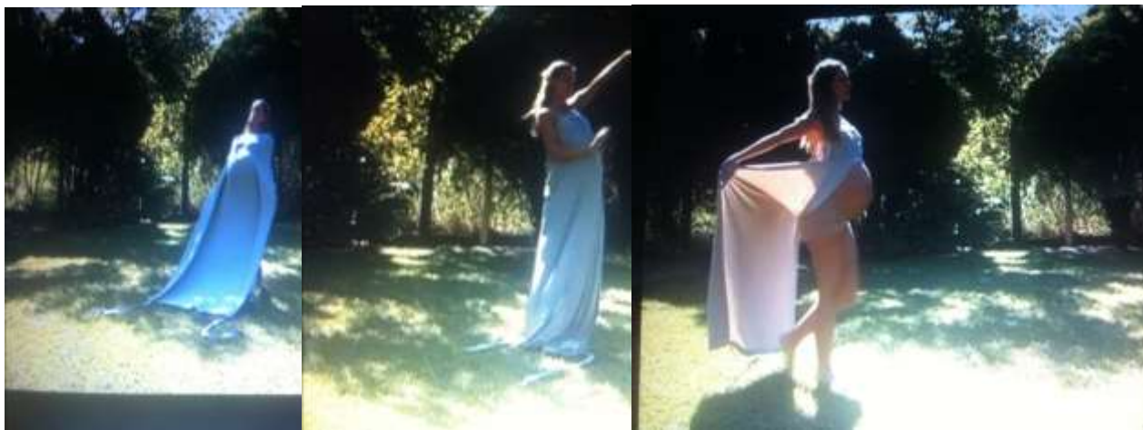
Figura 1, 2 e 3 - Início do processo de criação, 2011.

A criação coletiva é uma característica comum das criações contemporâneas, neste sentido a dramaturgia não se restringe ao fenômeno teatral; abrange outros campos de produções artísticas que se desprendem do uso da palavra unicamente para se contar uma história. Independente das hierarquias estabelecidas em um grupo de pesquisa, o ato criativo transcende a subjetividade do criador para se estabelecer no ECO do coletivo, assim como o objeto de estudo e os estímulos da sala de ensaio dão vazão à voz do artista-criador. Esta via de mão dupla entre o artista e seu grupo abrange uma infinidade de linguagens formais heterogêneas, onde, a proposta de um recorte para olhar a vida, estimula, sobretudo, o criador com sua própria biografia, neste sentido, Macedo, 2016, nos aponta que “...isso tudo é um desejo de imbricar a nossa dança ao que somos porque, de alguma forma, não há como nos escondermos nela, ao contrário, ela só fará sentido se nos despirmos” (MACEDO, 2016, 94).