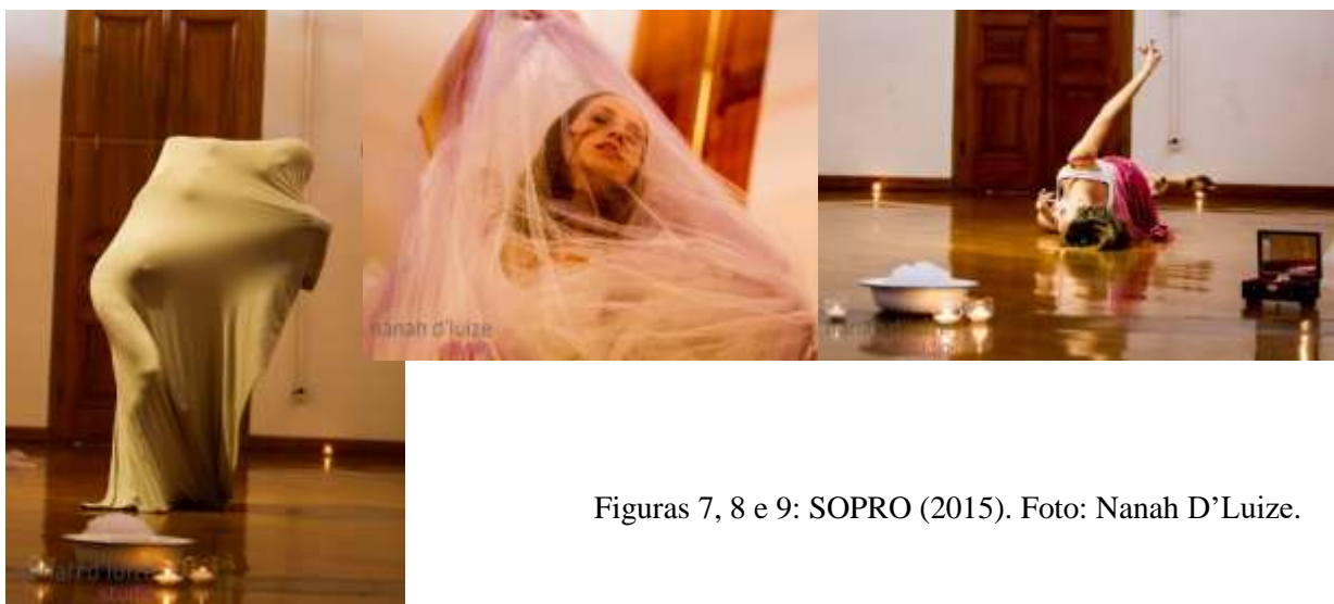
Figuras 7, 8 e 9: SOPRO (2015).

Unir os gestos precisos da bailarina, corporificar as palavras escritas no texto e construir a partir daí uma dramaturgia colaborativa e um diálogo constante da dança e do teatro foram as ferramentas artísticas para abordar a questão. A arte neste caso, não estava desprendida de um olhar histórico e nem enrijecida numa dramaturgia linear e é neste sentido que entendemos a teoria de Lehmann sobre a arte contemporânea e dialogamos, mesmo que “vulgarmente”, com a terminologia pós-dramática para abordarmos a criação de “SOPRO” e sua relação com a vida.