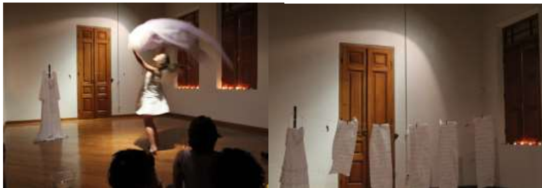
Figuras 4 e 5: SOPRO (2013) no Casarão do Marquês/Piracicaba.

O que era um procedimento para salvar vidas virou senso comum e motivo de lavagem cerebral nos consultórios médicos. A ocitocina, o hormônio do amor é injetável e descartável como algo que se consome friamente em alguma sala de parto. A medicina desaprendeu, a mulher desaprendeu, a criança desaprendeu e a sociedade perdeu. Mudar a forma como encaramos as maneiras de se vir ao mundo está sim intrinsecamente ligado à maneira de pensar o mundo e transformá-lo. SOPRO é fruto desta investigação e da reflexão de vida e morte, nascimento e renascimento. Não sem antes investigarem a si mesmas como mães e mulheres. E descobrir através da dança e do teatro, do corpo e da dramaturgia, uma união sensível para parir essas questões.