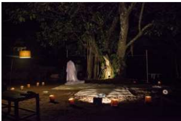
Figura 6: SOPRO, Campinas (2013).

A trilha sonora, o cenário e objetos cênicos chegaram à peça conforme a mesma ia sendo elaborada. Em sua maioria, os objetos cênicos se constituíram de antigos objetos da interprete, como elementos que recordassem sua infância. Exemplo a isto, podemos citar um caixa de música, objeto do quarto de criança da interprete, ao surgir como adereço também estimulou a criação da cena e impulsionou os sentidos elaborados ao longo do processo. Por ter sido apresentado em lugares alternativos e diversificados, cada espaço ganhou uma adaptação cênica e elementos vivos que compunham a cena com o olhar dramático a própria dramaturgia do espaço.