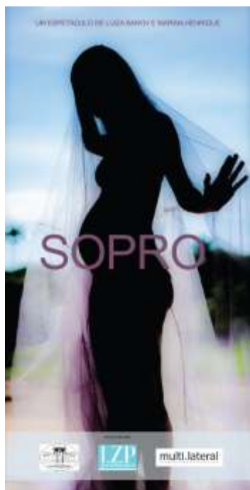
Figura 10: Cartaz de divulgação de SOPRO.

... a dança é um campo historiografável... trata-se de enxergar os atravessamentos entre os acontecimentos e os registros, olhar para os corpos da dança como restos que vivificam mnemonicamente possíveis histórias e destituir a hierarquia que aparta arquivos, testemunhos e repertórios. Afinal, apenas os restos são passíveis de sobreviver ao tempo, pois sua condição de emergência é sempre dependente de um corpo capaz de performar as memórias que o atravessam. Sendo assim, os corpos performam os restos da memória da dança, atualizando os documentos e desfragmentando os fatos. (NHUR, 2013, 57)